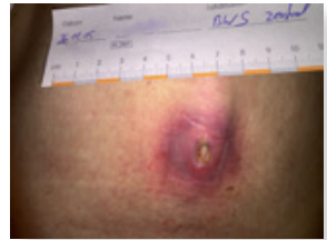
Abb. 3: Aufnahme vom 26.11.2015