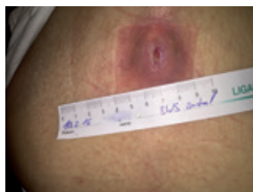
Abb. 6: Aufnahme vom 10.02.2016