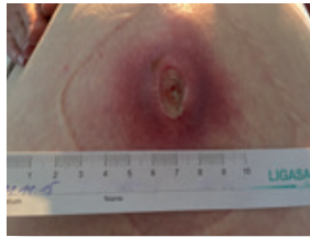
Abb. 2: Aufnahme vom 11.11.2015