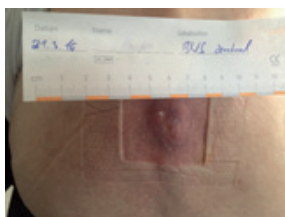
Abb. 7: Aufnahme vom 21.03.2016

Die Wunde zeigt weiterhin eine positive Heilungstendenz. Wundgrund hellrot granulierend, Wundrand gerötet und eingefallen. Umgebung leichte Rötung. Die Versorgung wurde angepasst und nur noch LIGASANO® weiß steril 5 x 5 x 1 cm verwendet.