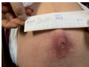
Abb. 4: Aufnahme vom 14.12.2015