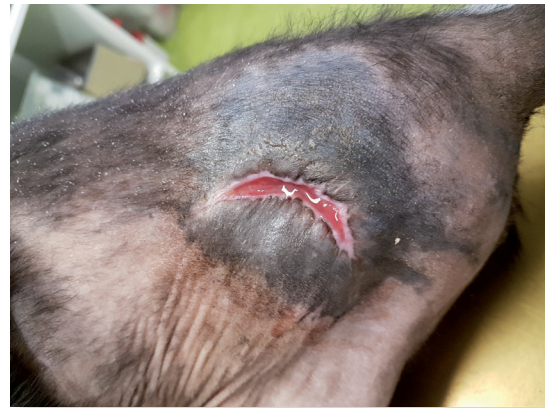
Abb. 2: Wundzustand am 08.03.2017