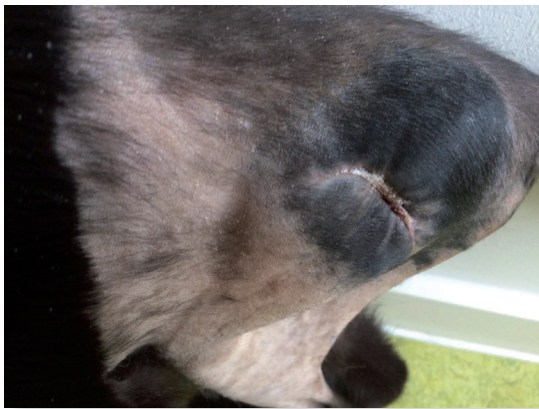
Abb. 3: Wundzustand am 14.03.2017