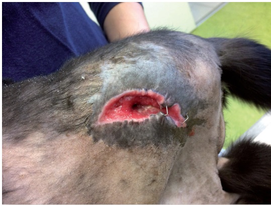
Abb. 1: Wundzustand am 03.03.2017

Tägliche Wundreinigung mit unsteriler Kernseifenlösung im wachen Zustand, LIGASANO® Roll weiß unsteril 0,6 cm als Wundaufgabe, Anzug für die Fixierung. Der Verband wurde täglich gewechselt, parallel dazu erfolgte Antibiotikergabe. Wundverschluss nach insgesamt nur 10 Tagen. An den Stellen, wo LIGASANO® weiß aufgelegt war, sind Haare nachgewachsen.