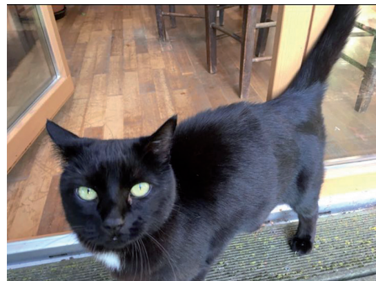
Abb. 6: 05.09.2017 Komplette Wundheilung