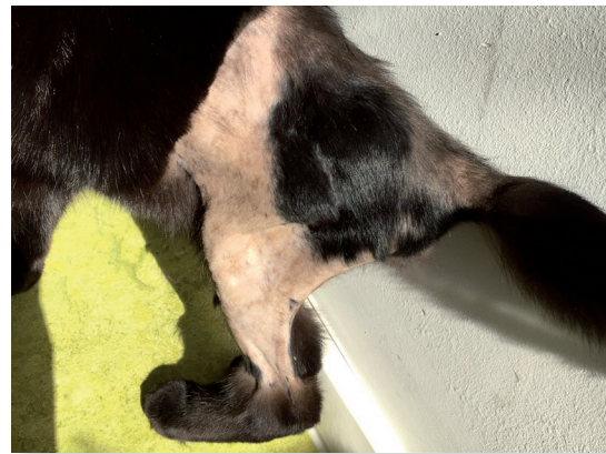
Abb. 4: Wundzustand am 31.03.2017