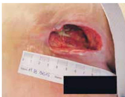
Abb. 8: 11.08.2015: Wundhöhle gut gesäubert, kein Wundgeruch mehr wahrnehmbar.