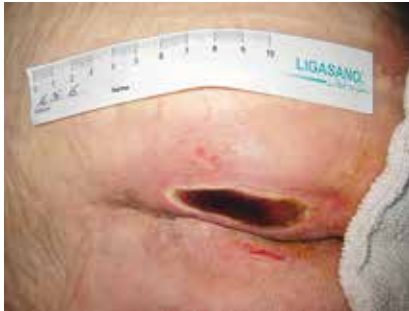
Abb. 1: 16.06.2015: Zustand der Wunde vor Behandlungsbeginn mit LIGASANO®

88jähriger Patient, Z. n. Tetraparese bei Sepsis mit aktuellem Nierenversagen sowie Spondylodiszitis BWK I und II, Dekubitus der rechten Gesäßhälfte, massive Schluckstörungen. Aufnahme in das Hospiz am 11.06.2015