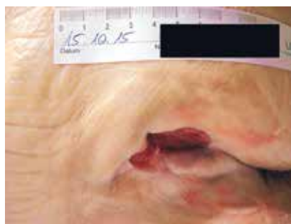
Abb. 14: 15.10.2015 Weitere Verkleinerung der Wunde