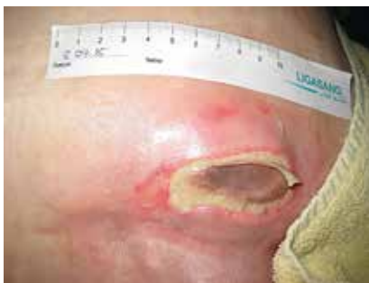
Abb. 4: 08.07.2015: Die harte Nekrose hat sich vollständig aufgelöst und ist nur noch mittig mit dem Wundgrund verbunden.

15 ml Jojobaöl (Simmondsia chinensis), 35 ml Mandelöl süß (Prunus dulcis), 8 ggt Lavendel fein (Lavandula angustifolia), 5 ggt Benzoe siam (Styrax tonkinensis), 2 ggt Karottensamen (Daucus carota).