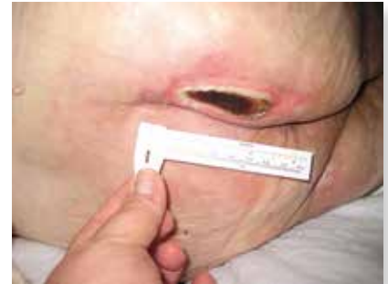
Abb. 3: 01.07.2015: Nekrose wird mehr und mehr aufgelöst.

Am 16.06.2015 zeigte sich die Situation wie folgt: Eine trockene, ca. 4 cm x 2 cm messende Nekrose hatte sich deutlich demarkiert. Die Wundumgebung war sichtbar gerötet und beim Abtasten auch verhärtet.