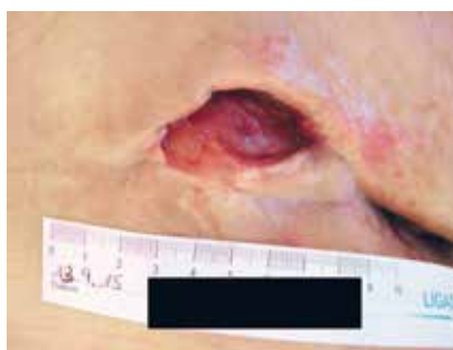
Abb. 11: 13.09.2015: Wunde sichtlich verkleinert, Wundränder gut durchblutet.