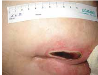
Abb. 2: 25.06.2015: Die Nekrose löst sich langsam von den Rändern her.