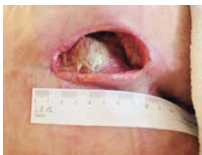
Abb. 7: 02.08.2015: Fibrinbeläge fast vollständig gelöst, Wundhöhle deutlich besser einsehbar.

Erste Erfolge zeigten sich schon zwei Tage später. Der Verbandswechsel musste nur noch 2x täglich erfolgen, da deutlich mehr Sekret vom Verbandsmaterial aufgenommen wurde. Die Fibrinbeläge lösten sich zunehmend und der Wundgeruch war deutlich eingedämmt. Die Wunde wurde weiterhin bei jedem Verbandswechsel mit der Wundpflegelösung ausgespült und eingesprüht.