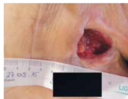
Abb. 12: 27.09.2015: Weitere Reduktion der Wundgröße und -tiefe.