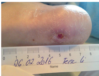
Abb. 5: 26.02.2016 Vollständige Abheilung und Epithelisierung.