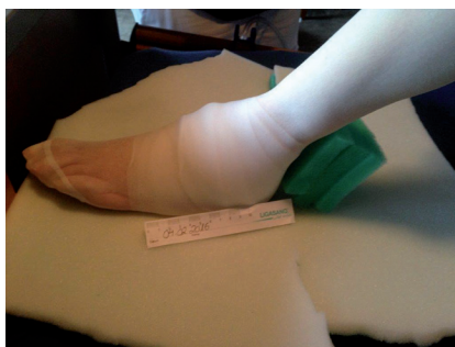
Abb. 2: 04.02.2016 Der Dekubitus wurde mit mehreren Lagen der sterilen 10 cm breiten Binde aus LIGASANO® weiß Binde steril 10 cm versorgt. Fixierung mit LIGAMED®/ix. Der Verbandwechsel erfolgte alle drei Tage.