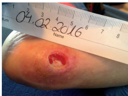
Abb. 1: 04.02.2016 Dekubitus Grad 2 an der rechten Ferse/Fußsohle. Zustand nach der Wundreinigung mit LIGASANO® Wundputzer® intensiv

60 Jährige, komplett immobile Patientin in schlechtem Allgemeinzustand. Langjährige Multiple Sklerose. Starke Kontraktionen an beiden Armen und Beinen. Versorgt in der häuslichen Umgebung durch einen ambulanten Pflegedienst mit Unterstützung der Familie. Immer wieder Entstehung von Dekubitalulcera, da die Patientin durch ihre körperlichen Einschränkungen äußerst schwer zu lagern ist und unter starken Schmerzen leidet. Sie liegt auf einem Wechseldrucksystem. Die Patientin ist geistig rege und voll orientiert.