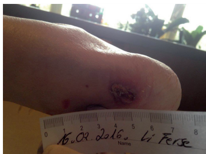
Abb. 4: 16.02.2016 Epithelisierungsphase. Die Wunde ist etwas trocken, daher wurden mehr Lagen der Binde gewickelt.